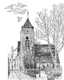
Paroisse sainte Colombe

Mercredi 16h-17h30 (Fermé le mercredi 17 février, messe des cendres) Au 5 rue Jaume