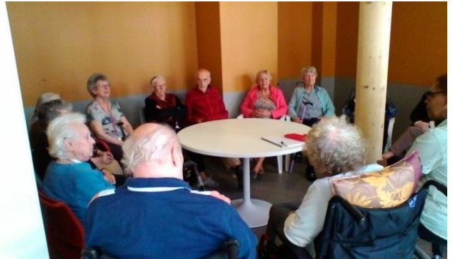
Commission d'animation, le 5 avril