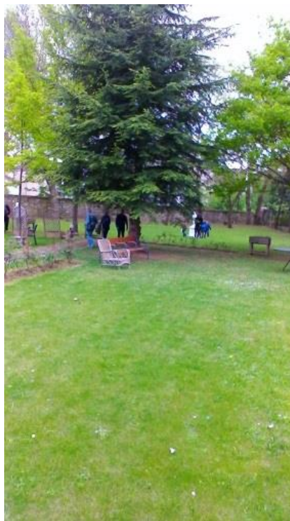
Chasse aux œufs de Pâques le 17 avril