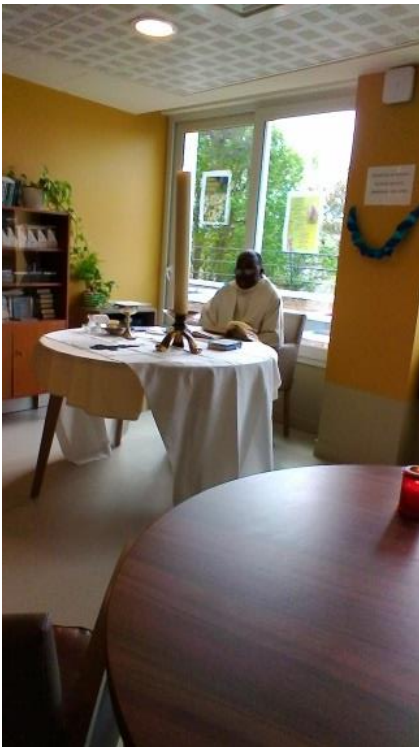
Veillée de Pâques le 15 avril