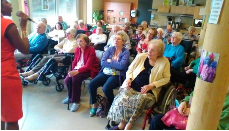
Spectacles des anniversaires, le 28 mars