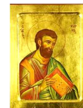
icône byzantine de Saint Marc

Erick Baldé PSJ Curé de la Paroisse St Colombe de Chevilly-Larue 5 rue Jaume 94550 Chevilly-Larue