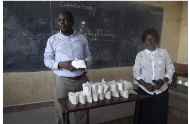
Craies qui serviront à payer les frais de scolarité

effectuant le paiement en nature des frais de minerval (frais de scolarité) évalués à 25 dollars par trimestre et par enfant. Une aide de TMS est nécessaire pour lancer ce projet : achat de moules et de matériel de fabrication, achat des matières premières .... La fabrication est assurée par des bénévoles. Les résultats sont au dessus de tous les espoirs : fin 2017, le don de 2500 euros a permis de scolariser 107 enfants dont 27 filles.