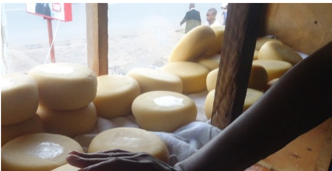
Fromages du Kivu

2016 : vu les bons résultats de la coopérative en 2015 (les cultures des pommes de terre ont produit environ 80 sacs équivalent à 1600 kg et environ 25 sacs des semences ainsi que 10 sacs de carottes et 3 d'oignons), et vu son bon fonctionnement il est décidé de permettre son développement au profit d'un nombre plus important de bénéficiaires. Il est proposé d'une part de passer de 50 à 100 mamans membres de la coopérative et d'autre part d'initier un projet de fabrication de fromage (le fromage du kivu est très connu en RDC : il peut être vendu à Kinshasa). (photos) TMS participera au lancement de ce projet.