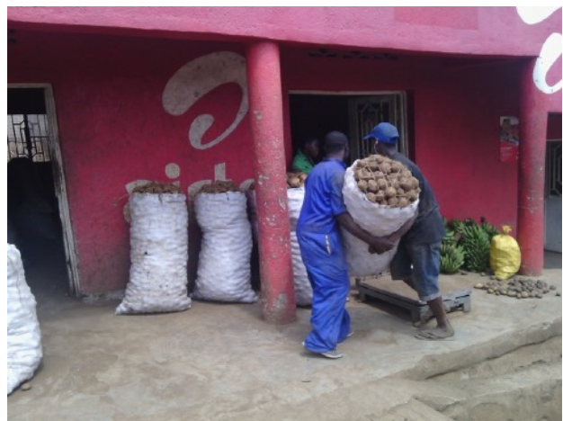
Belle récolte de pommes de terre

En 2015 afin de développer et rentabiliser leurs activités, 50 femmes se regroupent en coopérative : elles poursuivent leurs activités agricoles (pommes de terre, oignons, patates,