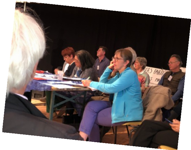
Vues de l'assemblée

Après deux ans de chantiers, le Forum de Jambville vient de conclure un cycle et marque un tournant historique pour notre association.