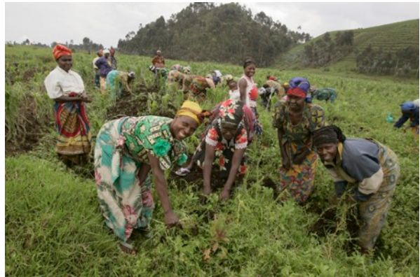
Travail aux champs. Cela pousse bien...

En 2014 : après la chute de groupe M23 et la sécurisation de la zone, les femmes peuvent repartir à Kibumba et redémarrer leurs activités agricoles. TMS interviendra pour l'achat de petit matériel (houes, brouettes...) et de semences. Quelques mois plus tard, la première récolte fournira 600kgs de pommes de terre.