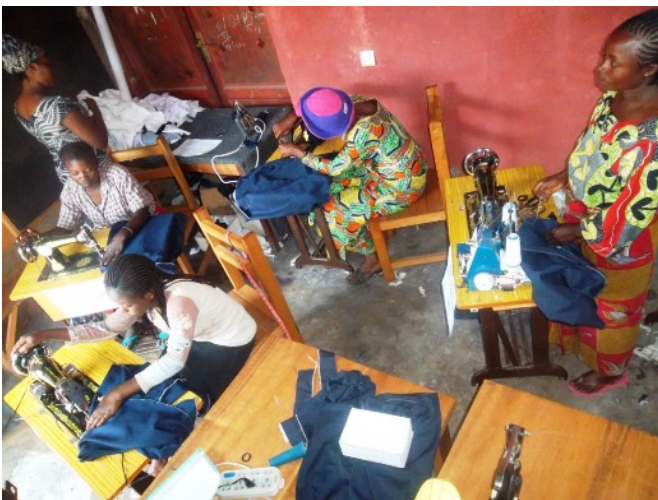
Atelier de couture

Fin 2010, nous sommes sollicités pour favoriser l'ouverture d'un petit atelier de couture : apprentissage et confection permettant de générer un revenu. Cet atelier débutera en 2011 et sera très utiles pour les mamans qui ne peuvent plus assurer les travaux des champs.